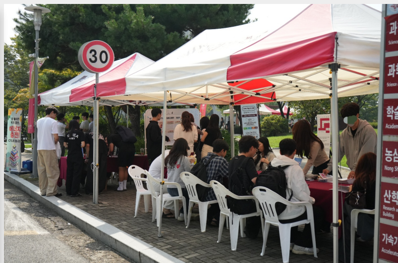
▲ 2025-2학기 CTL 홍보부스 (2025.10.01)

게임을 즐기며 CTL의 프로그램에 대해 알아가는 학우분들의 모습을 보니 뿌듯함이 느껴져 좋았는데요! 이번 행사에는 총 368명의 재학생들이 참여해주셔서 현장 열기를 더욱 느낄 수 있었습니다. 또 재학생들의 CTL 프로그램에 대한 의견을 묻고, 이를 CTL 운영하는데 피드백을 얻을 수 있었습니다. 바쁘신 와중에도 참여해주신 모든 학우분들 감사합니다! 다음 CTL 행사도 많이 기대해주세요 :)