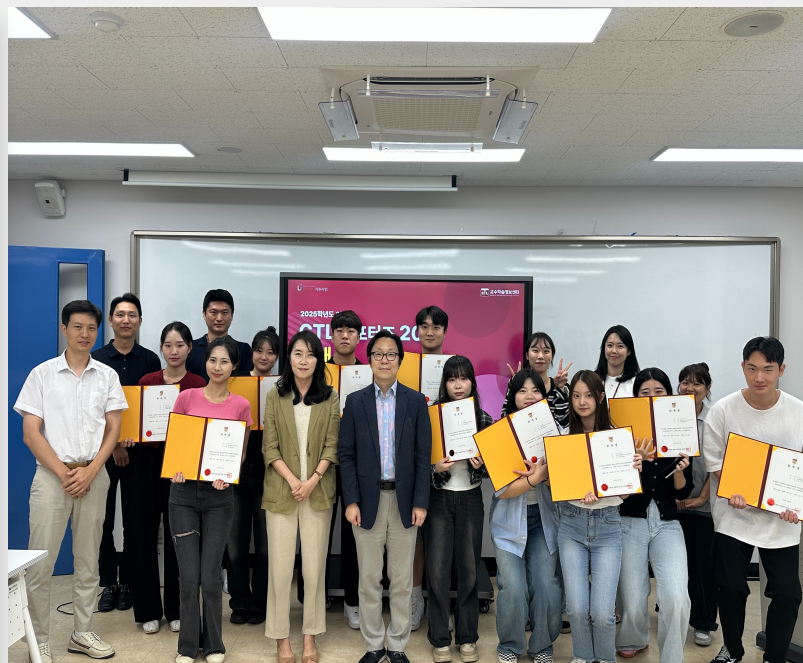
▲ 2025-2학기 CTL 20기 서포터즈 발대식(2025.09.16)

CTL 서포터즈 20기는 영상 콘텐츠나 카드뉴스 등 다양한 방식으로 교수학습정보센터의 프로그램에 관한 정보들을 알려드릴 뿐만 아니라 프로그램 후기 등 학우분들께 더 도움이 될 수 있도록 열심히 활동할 예정입니다. 학우분들과 교수학습정보센터의 소통 창구 역할을 해낼 20기 서포터즈의 활동에 많은 관심 부탁드립니다!